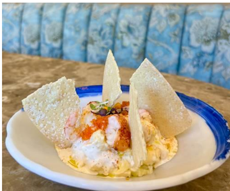
Ensaladilla de bogavante y gambas blancas, tobiko rojo, AOVE y escamas de sal