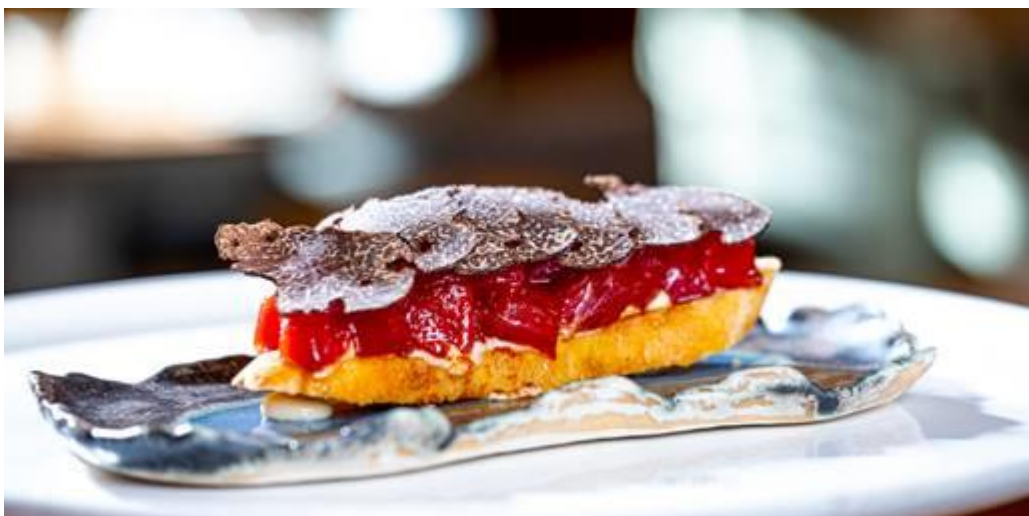
Tosta de tarantelo de atún rojo Gadira con trufa negra, tomate y soja